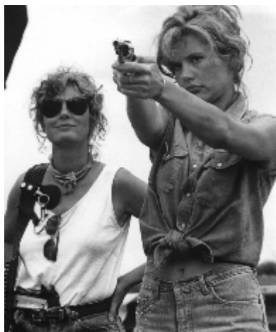
صحنه ای از فیلم تلم و لوئیز

تئاتر و فاصله همیشه بگذارد بین تماشاگر و اثر. تا تماشاگر غرق نشود و بتواند مرتباً تضادهای جاری در تئاتر را با فاصله گرفتن از اثر و فاصله گرفتن از احساساتی که میتواند آن تضادها را بیوشاند ببیند.