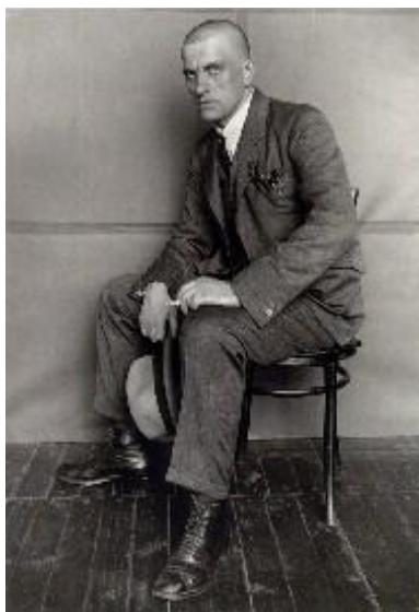
پرتره مایا کوفسکی شاعر انقلابی روسیه، اثر رود چنکو عکاس انقلابی روسیه

حالا که بحث قهرمانان و رل مدل طرح شد میخواستم اشاره ای هم بکنم به بحث‌هایی که در عرصه هنر مشخصاً در تئاتر از جانب برشت و بعد پیروان برشت که زیاد هم هستند مطرح شده. و همینطور در سینما، چون تفکرات برشت در حیطه سینما هم مطرح شده. باز مهم است که دید یکجانبه نگیریم از این بحث قهرمانان. برشت بحث‌هایی که ارائه داد و نوع تئاتری که پایه ریزی کرد، کلاً روی این بود که حول قهرمانان نچرخد. البته ویژگی تئاترش فقط این نبود، جنبه دیگرش این بود که نقش تماشاگر را مستقل کند از خود