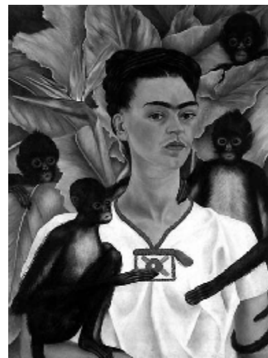
اتو پرتره اثر فریدا کالو نقاش مکزیکی

همیشه سر این هم جدل بوده. مثلاً مصاحبه جریبری با شاملو را نگاه کن. ... هنر بخش ناگزیری از فعالیت اجتماعی بشر است که از قدیم با سایر فعالیت‌های بشر مثلاً کار تولیدی و تجربه های علمی و مبارزه طبقاتی مرتبط و همراه بوده. این بخش از فعالیت بشر، یک فعالیت ذهنی است. هنر، خلق آثاری است که در ذهن پرورده می شود و شکل می گیرد. هنر انعکاس زندگی بشر است. کار و مبارزه بشر. چه مبارزه تولیدی، چه مبارزه طبقاتی در جامعه طبقاتی. انعکاس هست اما همانطور که ماژو هم گفته در سطح عالیتز، خیلی نزدیک به ایده آل، خیلی نمونه وار، خیلی پرشورتر از زندگی روزمره. این فعالیت، برای خودش قالبها و عرصه های مختلفی پیدا می کند. منظورم سبکها نیست. استفاده از حس‌های مختلف را می گوئیم: حرف زدن، دیدن، شنیدن. یعنی هنر از چیزهائی که ابزار ارتباطی بشر برای نگاه کردن به خود و دنیای بیرون از خود است استفاده می کند. تولیدات هنری توسط آدمها مصرف می شود تا همزمان دو کار را پیش ببرد. آثار هنری، ذهن بشر، ایدئولوژی و دیدگاهش را پلایش می دهد، باز می کند، تکامل می دهد، یا برعکس، اگر هنر ارتجاعی باشد ذهن را تخریب می کند، آدم را تنگ نظر می کند. یعنی چه مثبت چه منفی نگرش و ایدئولوژی بشر را تحت تاثیر قرار می دهد.